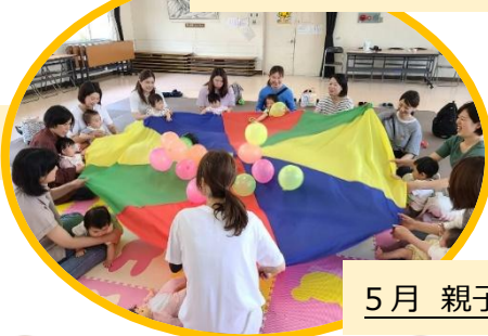
5月 親子でふれあいリトミック♪