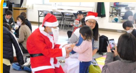
12月 楽しいクリスマス会♪