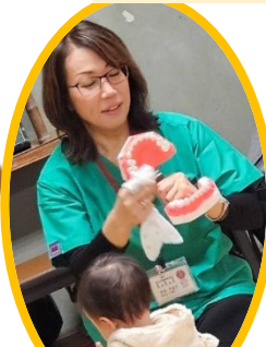
11月 歯と口の健康について