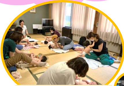
7月 ベビーマッサージ！