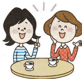
人との関わり (認知症カフェなど)