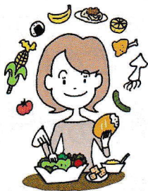
バランスの良い食事