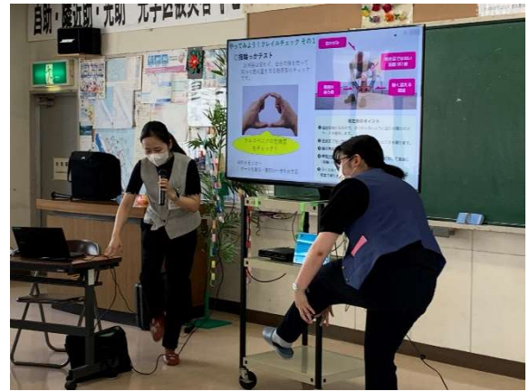
サロンでのお食事とすこやかセンターからの講座（フレイルについて）指輪っかテストしてみてね。