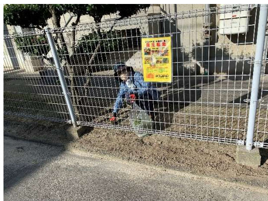
社会奉仕活動（小学校の花壇の草取り・体育館横の草刈り等）きれいになると気分が良いですね。