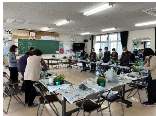
サロン 寄せ植え講座（きれいな寄せ植えが出来ました。）光学区公衆衛生のご協力に感謝してます。