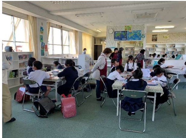
託児ボランティア（光小学校 参観日 図書室にて）参観日後の懇談会時に託児を行っております。