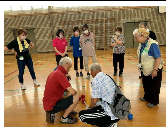
ボッチャをたのしもう（霞クラブの方もご協力頂きました。）