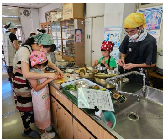
料理教室（親子で参加）ご家族で参加される方も家では食べないものを自分で作ると笑顔で完食。