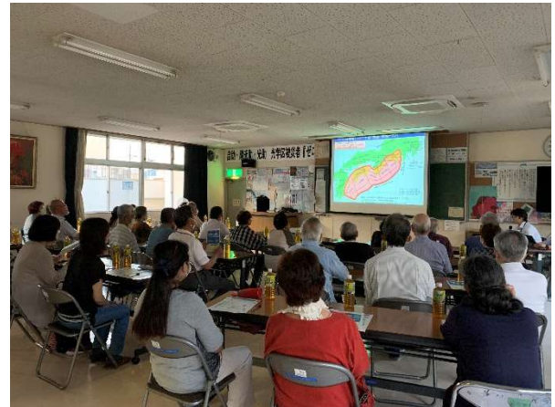
ボランティア研修会（耐震について）昭和56年6月1日以前は旧耐震基準で少し心配。