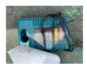
燃えないゴミを出している →役員で該当日に再度出した