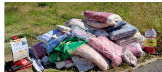
回収後に出されたか? →福山市に連絡し対処