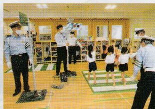
保育園児対象の交通安全教室