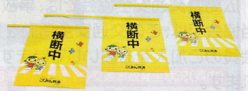
寄贈された横断旗

1月31日(水)、こくみん共済coop広島推進本部から、交通事故防止に役立ててもらいたいと横断旗4,000本を寄贈していただきました。この横断旗は、県内の各地区交通安全協会に分配し、通学路や横断歩道などで使用し、歩行者の交通事故防止活動に活用させていただいております。配布を希望される保育所、幼稚園、小学校、町内会等がございましたら、最寄りの地区交通安全協会、または広島県交通安全協会にお問い合わせください。