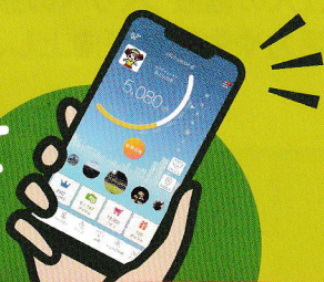
フレイル予防イメージキャラクター 「フレイル予防ローラ」