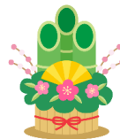
もちつきと豚汁のふるまい

わらの入手が難しくなったので、昨年度からわらの代わりにムシロを使った「創作とんど」になりました。子どもたちも花や習字を飾るのを手伝いました。