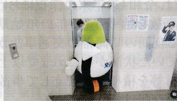
ヒコアくんエレベーター ギリギリでも頑張りますっ!!