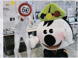
セーフティープラザに設置している 機器の使い方