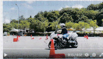
二輪車講習会での 白バイ隊員による模範走行