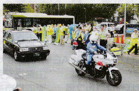
秋の全国交通安全運動出発式