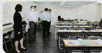
最終審査の様子(ポスターの部)

広島県内の小・中学生を対象に、交通安全ポスターと作文のコンクールを開催しました。小・中学校376校からポスター7,627点、作文1,053点の応募があり、審査の結果、広島県知事賞などの各賞が決まりました。ポスターの部で特に優秀と認められた作品27点を、次の5会場で展示する予定です。是非、お近くの会場をご覧ください。