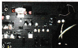
反射材用品(反射時)