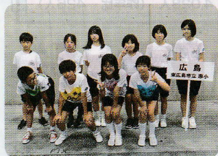
全国大会出場のみなさん