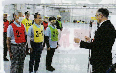
優勝した広島東Bチームのみなさん