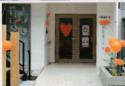
地域包括支援センター野上

9月は「世界アルツハイマー月間」でした。その中でも9月21日は「アルツハイマーデー」であり、それにちなみ、アボーデひかりでオレンジデーが開催され、包括野上の事務所もオレンジ色で飾り付けをしました！