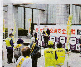
交通安全運動の開始式

通安全教室の開催による安全意識の啓発など、活発な交通安全活動を展開しています。今後も「日本一安全・安心な広島県の実現」を目指し、一昨年掲げた「アンダー60作戦」の達成に向けて、交通安全活動を積極的に展開していきたいと思ひます。