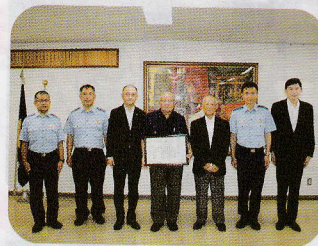
伝達の様子(打越前会長)