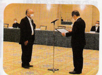
贈呈の様子(賀谷前会長)