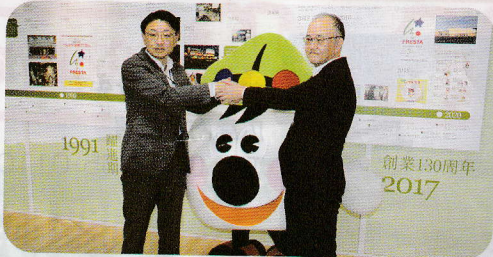
株式会社フレスタホールディングス管理本部渡辺本部長(左)と 岩上専務理事

普段では聞くことができない放送ですので、流れてきたときは、是非、内容を聞いてください☆