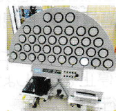
運転・歩行能力診断点灯くん

ドライバーも歩行者も交通場面で必要な「認知力」「判断力」「動作力」「瞬間記憶力」などをゲーム感覚で楽しく診断できます。