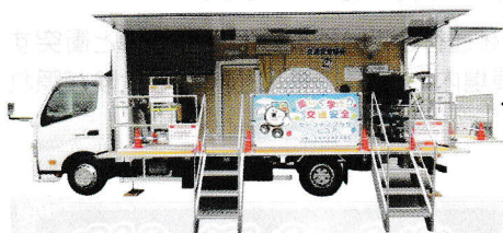
セーフティプラザ ヒコア