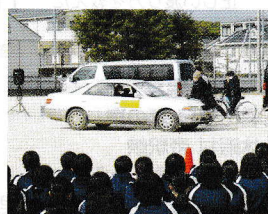
スタントマンによる交通安全教室

今年度は、新型コロナウイルスの収束を祈りつつ、警察署等関係機関との更なる連携を図り、地域の皆様のご協力をいただきながら、交通事故防止活動に役員・職員一同努めてまいります。