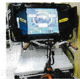
自転車シミュレーター

ドライバーも歩行者も交通場面で必要な「認知力」「判断力」「動作力」「瞬間記憶力」などをゲーム感覚で楽しく診断できます。