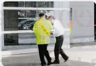
広島県東部運転免許センター