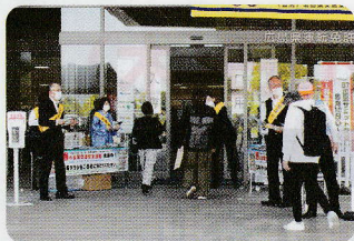
広島県運転免許センター

5月11日(木)から20日(土)まで実施された、「春の全国交通安全運動」の期間中、広島県運転免許センターおよび広島県東部運転免許センターで幟旗を掲示するなど、同運動の広報を実施しました。また、5月12日(金)には、各運転免許センターを訪れる方々に、交通安全グッズを同梱した交通安全チラシを配布し、無事故・無違反を呼びかけました。