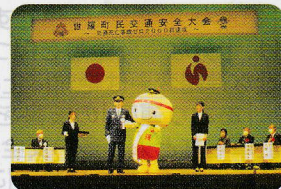
せら坊が一日署長に!