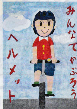
第71回「広島県知事賞」 (ポスターの部)