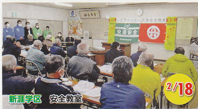
新涯学区 安全教室