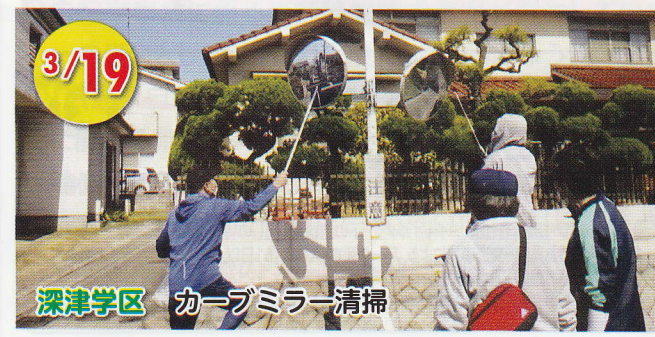
深津学区 カーブミラー清掃