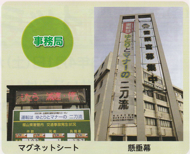
マグネットシート