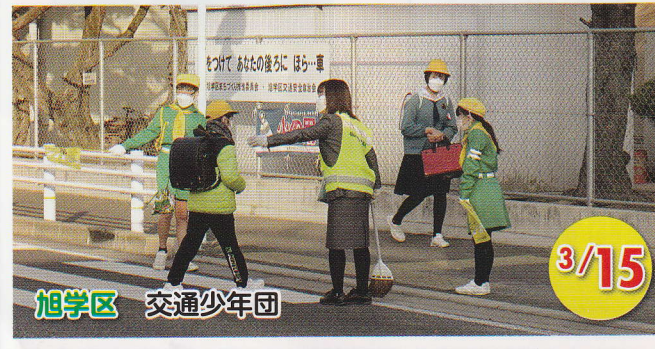
旭学区 交通少年団