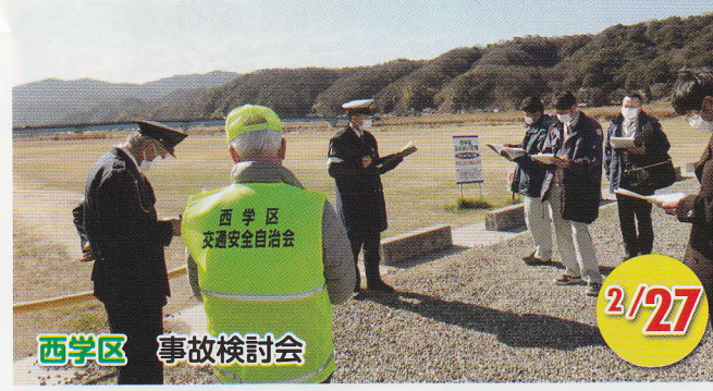
西学区 事故検討会