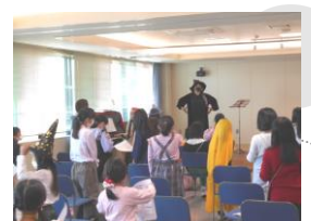
【海のみえる合唱教室】

【問合せ先】 福山市役所まちづくり推進部 まちづくり推進課 TEL(084)928-1243 FAX(084)928-1229