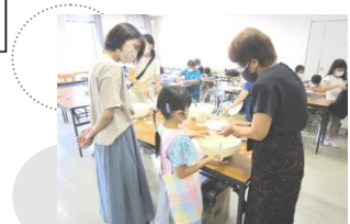
【びんごアート研究会】