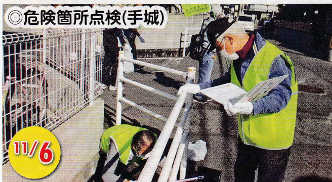
◎危険箇所点検(手城)