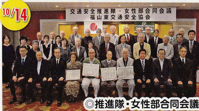
交通安全推進隊・女性部合同会議 福山東交通安全協会