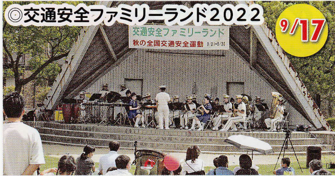
◎交通安全ファミリーランド2022