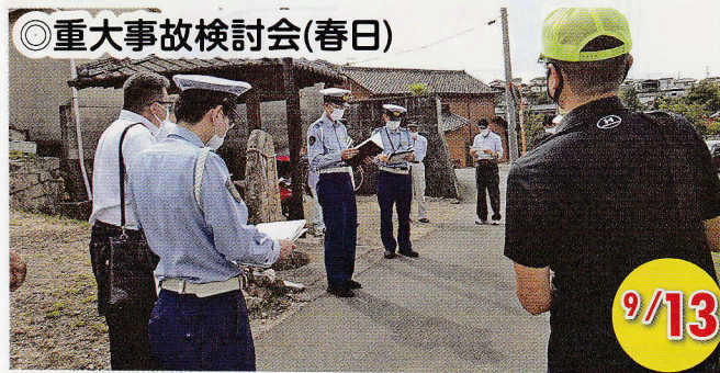
◎重大事故検討会(春日)