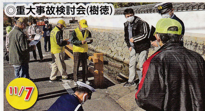
◎重大事故検討会(樹徳)