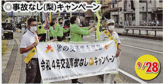
◎事故なし(梨)キャンペーン