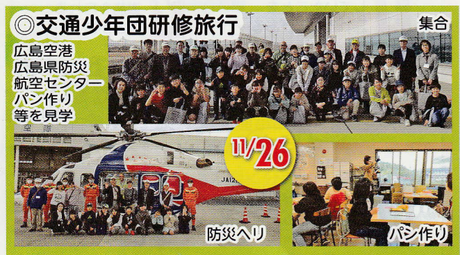
◎交通少年団研修旅行