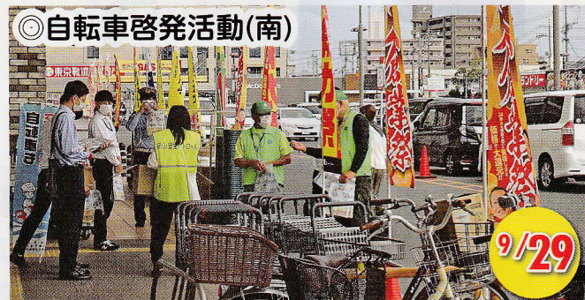
◎自転車啓発活動(南)