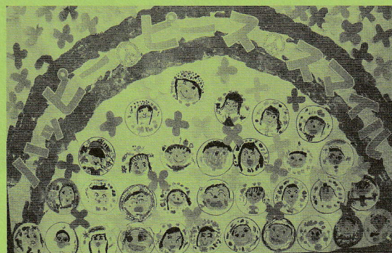
2021年平和アピール展の作品