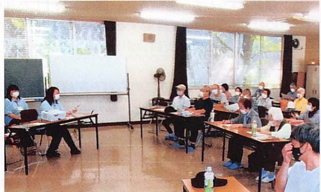
西深津学区 交通安全教室