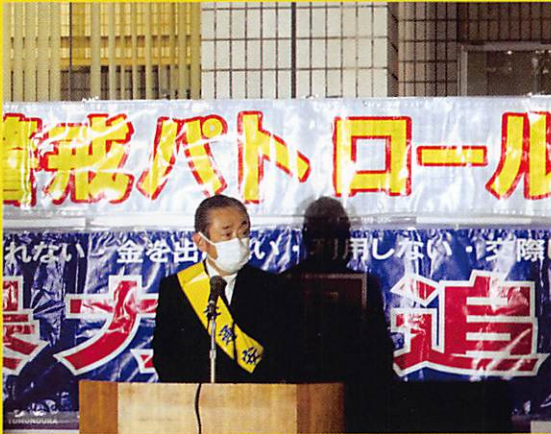
小丸会長あいさつ