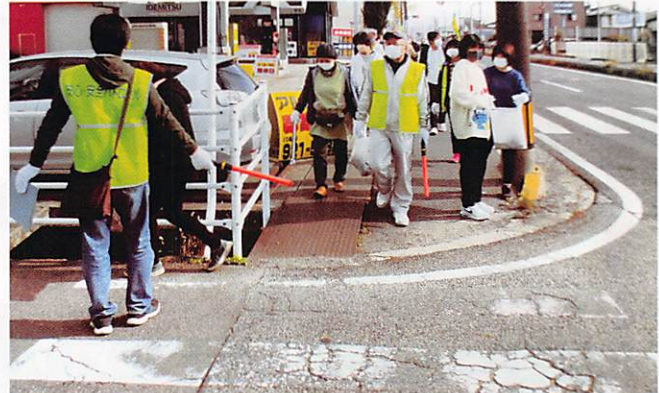
手城学区 清掃活動