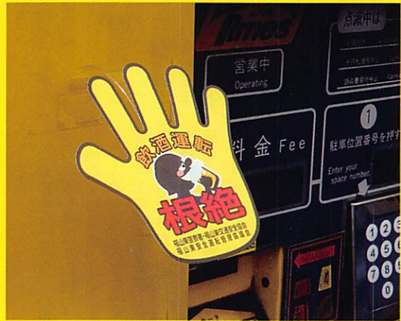
精算機の手形ポップ