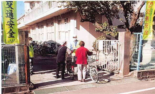
霞学区 交通安全活動