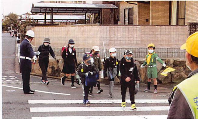
坪生学区 交通少年団