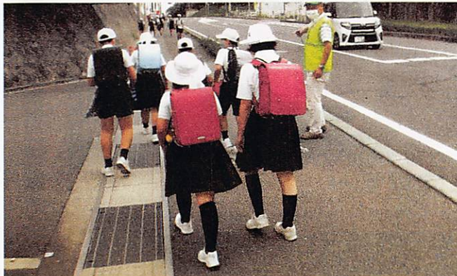
伊勢丘学区 交通安全通学指導