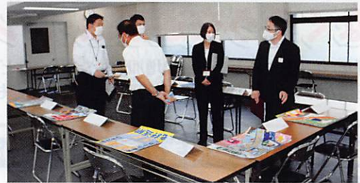
最終審査会の様子