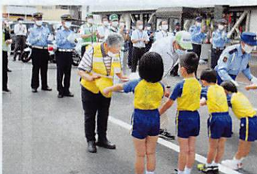
安全運動出発式における感謝状授与

誰しも心から願うことは、安全・安心な社会です。佐伯交通安全協会は、JR五日市駅前、大型商業施設などでの街頭キャンペーン、児童館・幼稚園などでの交通安全教室、通学路などでの広報活動等、歩く人、自転車に乗る人、車を運転する人など、あらゆる人を対象に、交通事故のない社会づくりをめざして、地域と連携した活動を推進してまいります。